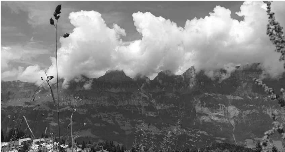
Einblicke in den Tagesausflug