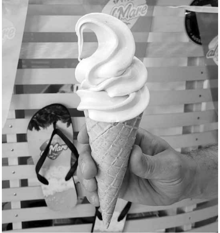
Immer wieder im Einsatz: unsere Softeismaschine

Als Verein möchten wir verantwortlichen Umgang mit unseren Finanzen üben. Aus diesem Grund vermieten wir auch unser Inventar an Technik und anderem Material. Organisationen, welche im Sozial- und Jugendbereich aktiv sind, gewähren wir Sonderkonditionen.