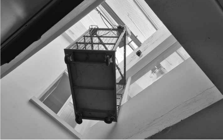
Der ‚Thurduck‘ an der Grabenstrasse 12 mit seinem industriellen Charme