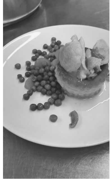
Feine Menues gibt es in der Gassenküche

«Das ist Glück: eine heisse Suppe, eine Schlafstelle und keine körperlichen Schmerzen - das ist schon viel» (Theodor Fontane)