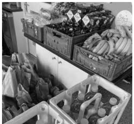
Einblicke ins Leben der Gassenküche